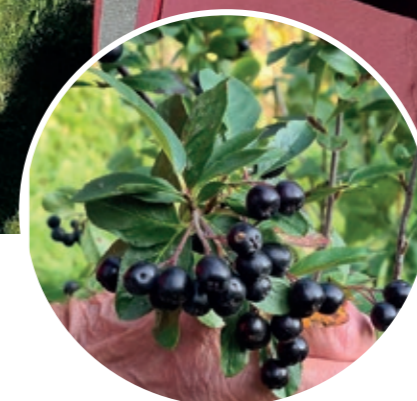
Här ser vi superbäret aronia.