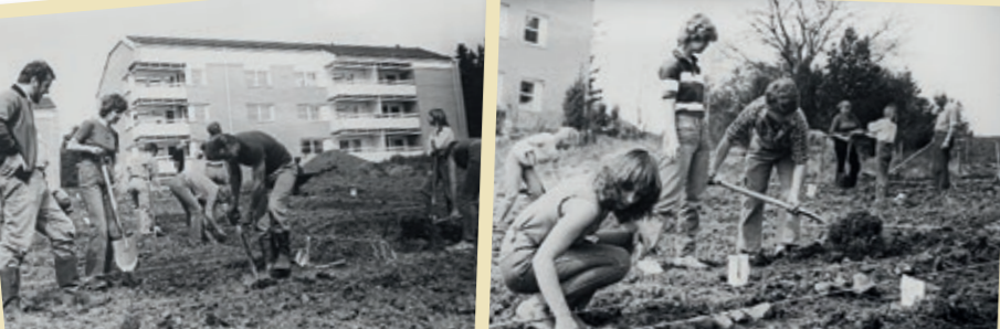
Föräldrar och ungdomar hjälps åt att anlägga sina odlingslotter i början av 1980-talet.