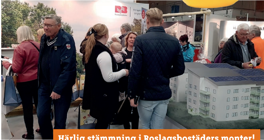
Härlig stämning i Roslagsbostäders monter!